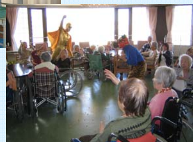
節分（豆まき）：平成23年2月3日（木）