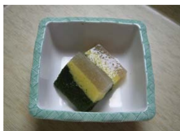
ほうれん草のおひたし