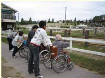
愛知牧場へ出掛けました