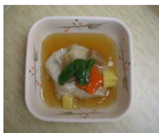
白身魚のかぶら蒸し