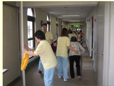
初期消火訓練、 避難訓練を行いました