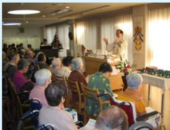
神父様からお祝いのクッキー が配られました