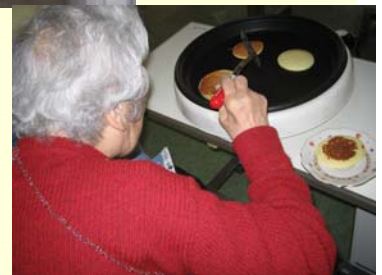
おやつ作り：11月25日（木）