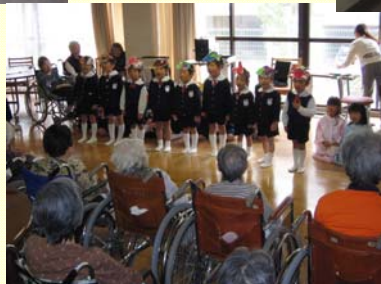
幼稚園児慰問：平成22年10月27日（水）