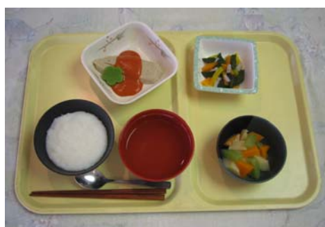
魚のムニエル・トマトソースがけ、 筍と落の煮物、 海藻サラダ