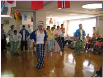
職員の障害物競走