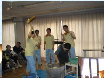
職員が力を合わせ 餅をつきました